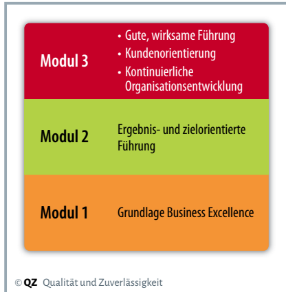
Tabelle 1. Aufbau der Schulungen

ermöglicht eine ausgewogene Sicht auf die Dinge. Die Leitung des Geschäftsbereichs entscheidet nach der Analyse des Feedbackberichts jeweils, welche Maßnahmen für den Geschäftsbereich umgesetzt werden. In einem der ersten Assessments wurde zum Beispiel kritisiert, dass im Umgang mit den Interessengruppen kein einheitliches Vorgehen vorhanden sei. Daraus resultierte ein geschäftsbereichsweites Stakeholdermanagement nach dem St. Galler Managementmodell. Dieses umfasst die sieben Interessengruppen Kunden, Mitarbeitende, Staat/Behörden, Lieferanten, Kapitalgeber, Öffentlichkeit/Verbände sowie Mitbewerber und enthält einen Betreuungsplan.